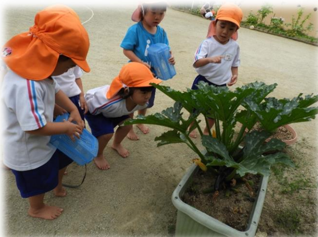
↑ 園庭でズッキーニを見ながら会話しているのは3歳児さくら組のこどもたちです。「たべたことな〜い」「ほくたべたよ」…。