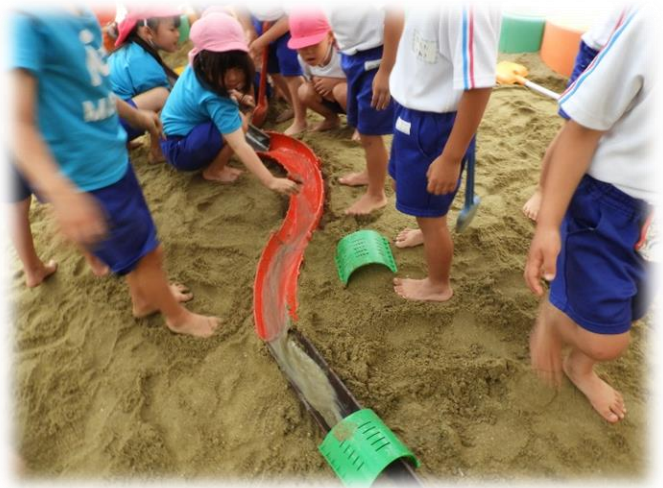
↑ 水遊びもバリエーションは豊富です。砂場に水を引いてダムを造っているのでしょうか、歓声が上がっています。5歳児ほし組