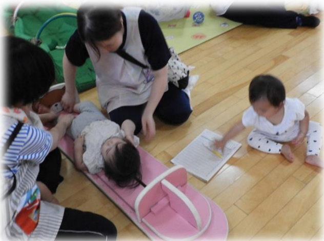
↑ 0歳児つぼみ組の発育測定です。身長を測定中です。全員の測定後、先生たちから歓声があがりました。全員伸びていたそうです。