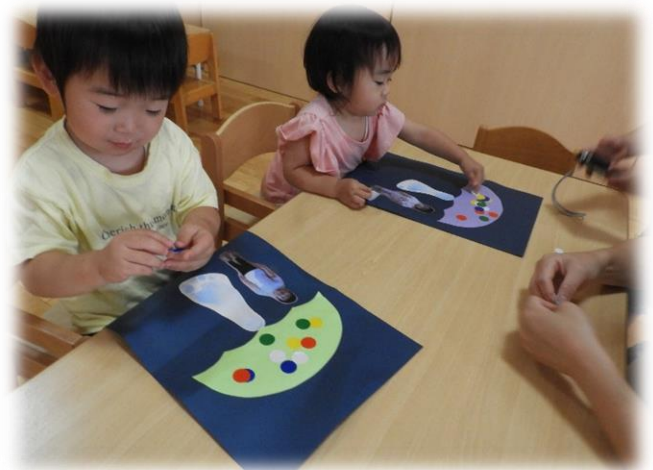
↑ 1歳児たんぼぼ組の造形遊びです。雨傘にシールを貼っています。取っ手と芯は子どもたちの足形スタンプです。